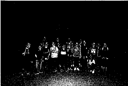
Naturpark-Schule Malborn auf Fledermausexkursion